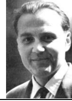
В. О. Сухомлинський