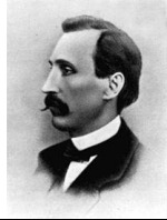
П. О. Куліш